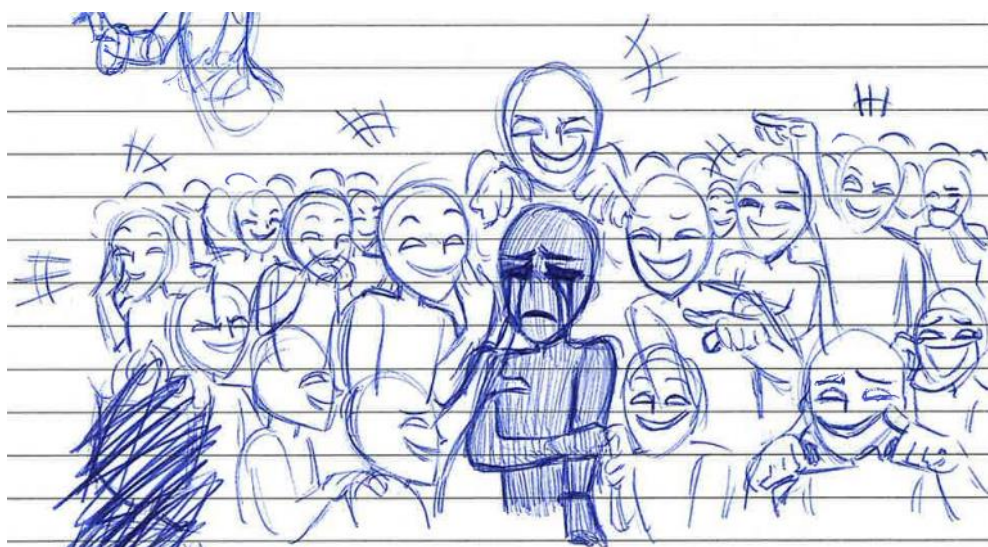
(tekening gemaakt over pesten door leerling Stella Maris College)